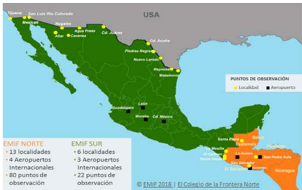
Figura 4. Cobertura geográfica en México y Centroamérica de la EMIF Norte y de la EMIF Sur

Por su parte, la EMIF Sur, recoge información en la frontera con Guatemala (del lado de Guatemala) desde su inicio en 2004, de guatemaltecos de 15 años o más que van a cruzar la frontera sur mexicana y de los que regresan de trabajar en localidades fronterizas y otras más alejadas del estado de Chiapas en México. También, desde el 2004, se obtiene información de aquellos migrantes mayores de edad de Guatemala que son deportados por las autoridades de México y Estados Unidos al no tener la documentación migratoria requerida. A partir del 2008 se incluye a migrantes de El Salvador y Honduras devueltos a sus respectivos países igualmente por autoridades de México y Estados Unidos. En este caso los cuestionarios se levantan en los puntos donde los migrantes son entregados a las autoridades de sus países, sea vía terrestre o aérea (ver Figura 4).