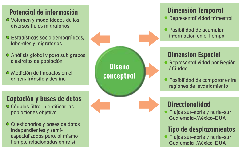
Figura 2. Diseño conceptual Encuestas sobre migración en la frontera norte y sur de México

La Encuesta sobre Migración en la Frontera Norte de México se aplica desde 1993 al presente y la Encuesta sobre Migración en la Frontera Sur de México se levanta desde 2004 al presente, ambas como proyectos interinstitucionales. 3 Estas encuestas de muestreo probabilístico, 4 están enfocadas en la movilidad y la migración laboral en las fronteras terrestres del norte y sur mexicano. En general, ofrecen datos sistemáticos y confiables sobre el volumen, las características sociodemográficas, laborales y migratorias de los flujos de mexicanos que se desplazan a la frontera norte de México y a Estados Unidos, de los guatemaltecos que llegan y regresan de trabajar en el sur de México y de los migrantes procedentes del Triángulo del Norte (El Salvador, Honduras y Guatemala) que tienen por destino Estados Unidos y para ello transitan por México. 5